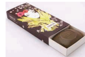
ESTUCHE AÑOS 60S VANILLE CHIC