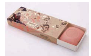
ESTUCHE AÑOS 70S FLEUR MAGIQUE