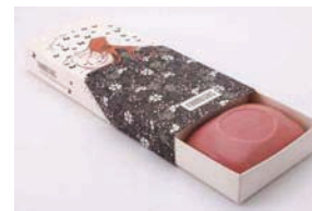
ESTUCHE AÑOS 20S ORANGE EXOTIQUE